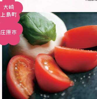
大崎 上島町 庄原市

旨味を凝縮し糖度8度以上 にした亀田農園の亀ちゃんト マト「味特」素材の美味しい さを味わって頂くために、庄 原市で作られるモzzarellaチ ーズとカプレーゼにしました。