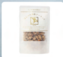
ほんのり酒粕アーモンド