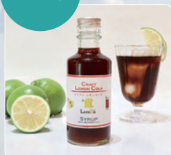
レモンクラフトコーラ