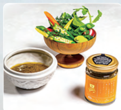
ちりめんバーニャカウダ