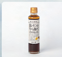
島レモンの から揚げにかけるたれ