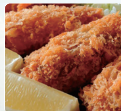
倉橋島の大粒かきフライ