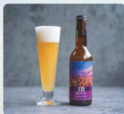
Sunflower White (麦酒)