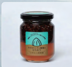
カカオニブと藻塩のはちみつ