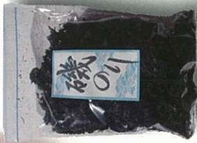
瀬戸内海の磯のり