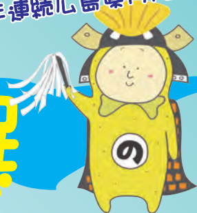
因島イメージキャラクター 『はっさく丸』