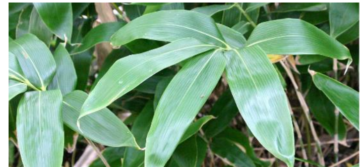
クマザサ 産地：青森県八甲田山系 太古の自然が保たれる原生林で、力強く生い茂ったクマザサ

美しい肌に必要なのは生命力。 とことん選び抜いたら、 日本に古くから伝わる素材に辿り着きました。