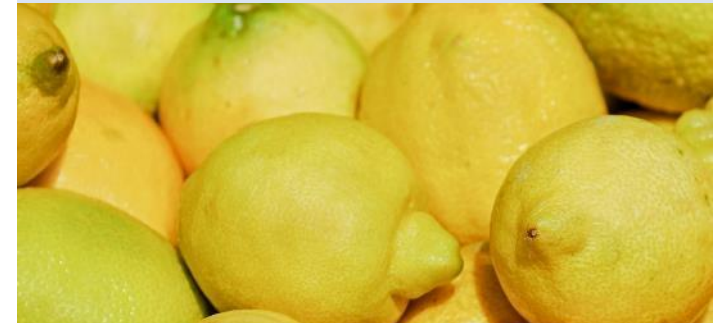
レモン 産地：広島県生口島 暖かく太陽が降り注ぐ地で、みずみずしく香り豊かに実ったレモン