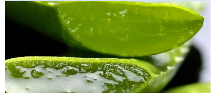
アロエ 産地：沖縄県宮古島 青い海と美しいサンゴ礁の地で、肉厚で水分たっぷりに育ったアロエ