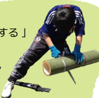
写真は田舎の遊び体験のイメージ

自分で野菜を育てて収穫する。季節ごとの土地の恵みを味わう。自然のもので雑巾や道具を作ってみる。こうした「自分で生活を作る面白さ」が里山暮らしの醍醐味です。ツアーでは、畑での野菜収穫や、竹を使ったモノ作りに挑戦します!