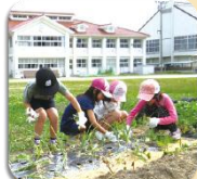
写真は吉和学園の生徒の活動イメージ

施設一体型、小中一貫教育の吉和学園。現在約40名の小中学生と一緒に掃除をし、手作りの給食を食べ、授業で交流し、地域の行事や達人から学んでいます。温かみある校舎を訪問し、特色ある教育について伺います。