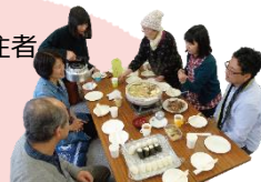
写真は参加者と地域住民の交流会イメージ

移住後の暮らしは実際に住む人に聞くのが一番。買い物や病院などの日常や、苦労話、移住決断のポイントなど、ざっくばらんに聞いてみましょう。もちろん、新鮮な採りたて野菜と地元食材のBBQも楽しんで!